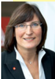
Helga Schwitzer, geschäftsführendes Vorstandsmitglied der IG Metall

viele Menschen können nicht bis zum 65. Lebensjahr arbeiten, und schon gar nicht bis zum 67. Sie müssen selbst bestimmen können, wann sie aus dem Erwerbsleben aussteigen. Die Altersteilzeit ist dafür ein gutes Mittel. Außerdem ermöglicht sie, dass junge Menschen die älteren Beschäftigten ersetzen. Die