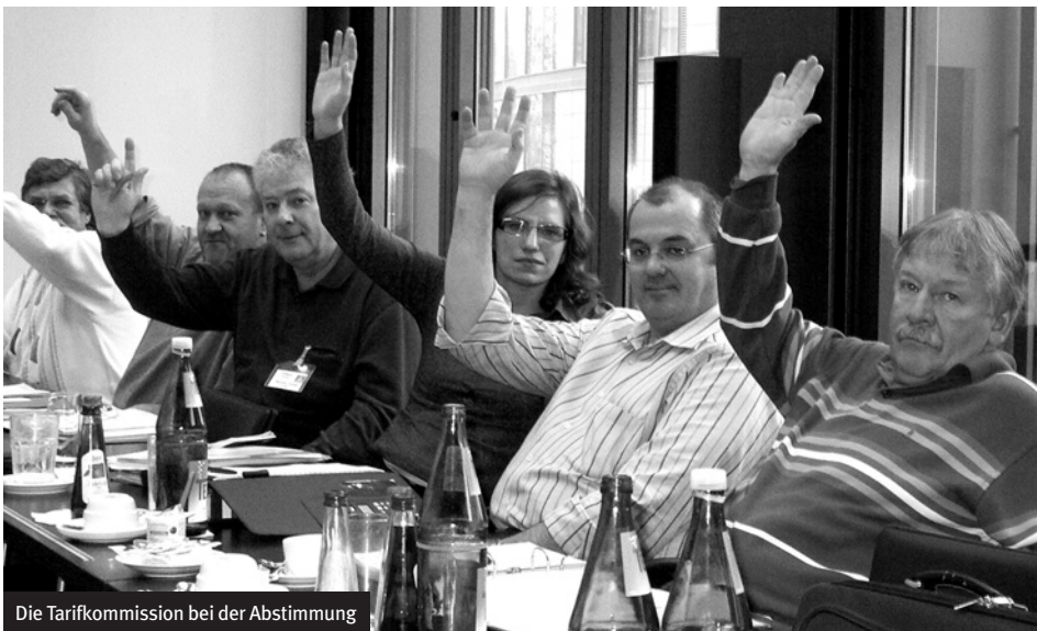
Die Tarifkommission bei der Abstimmung

D ie Geschäftsleitung schert es offensichtlich wenig, dass diese Rechte per Gesetz festgeschrieben sind. Dass sich in der Bundesrepublik jedermann an die geltenden Gesetze zu halten hat, auch Pfleiderer, interessiert die Geschäftsleitung scheinbar nicht. Ihr Standpunkt: »Der Herr im Haus bin ich.« Frühkapitalistische Verhältnisse eben.